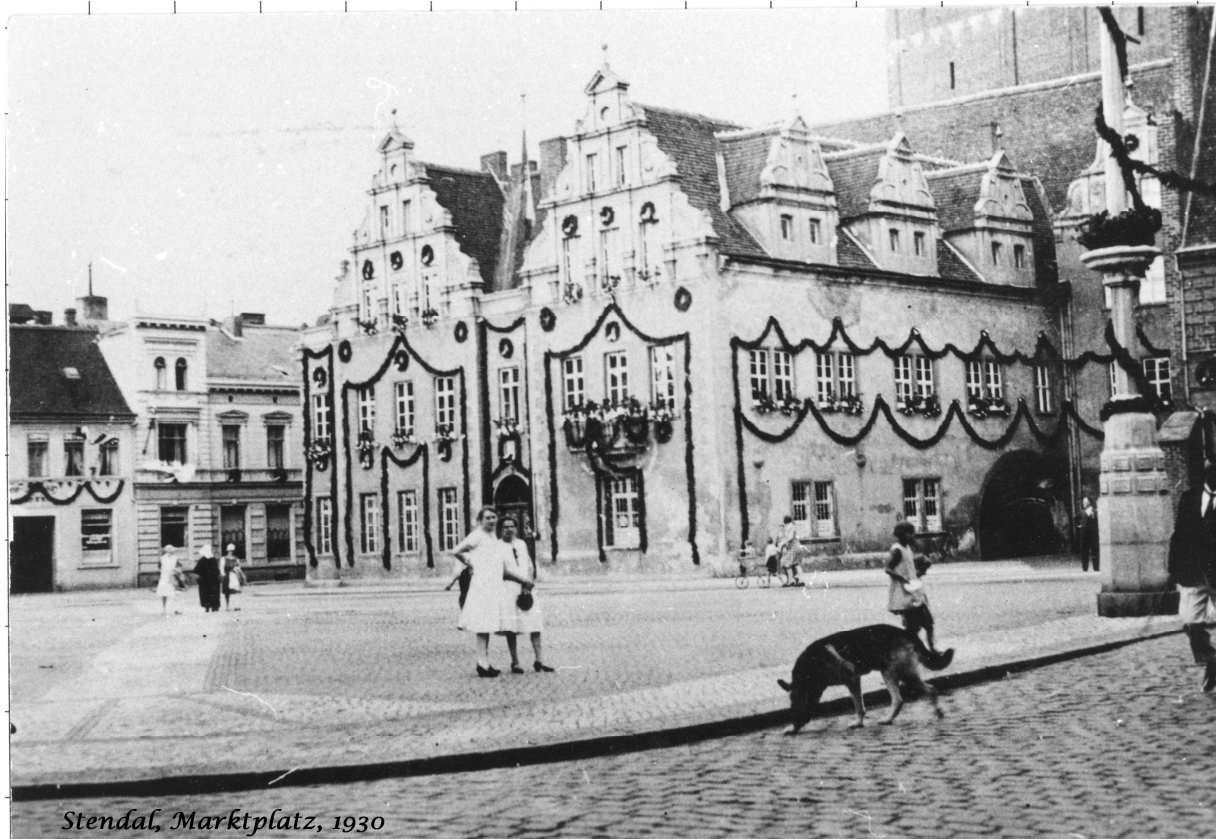
Stendal, Marktplatz, 1930