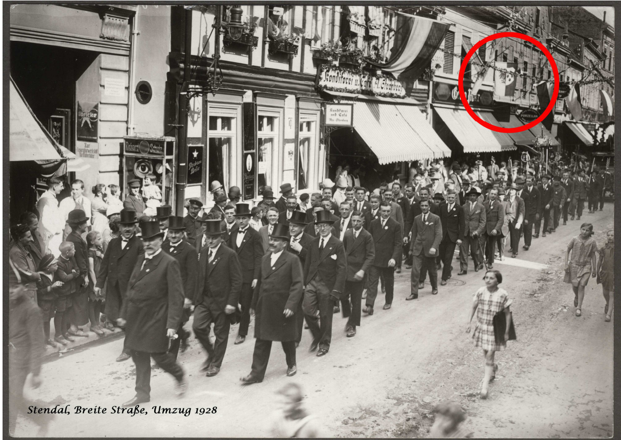
Stendal, Breite Straße, Umzug 1928