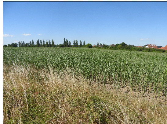
Abb. 3: Blick über die Erweiterungsfläche vom Feldweg, der die Fläche im Nordwesten tangiert (03.07.2018,)

Südlich der Erweiterungsfläche stockt an einem Feldweg eine aus Pyramidenpappeln gebildete lückige Baumreihe in deren Unterstand einzelne Sträucher wachsen. Entlang der Baumreihe befindet sich wieder ein schmaler Streifen aus ruderalen Gras- und Staudenfluren. Östlich auf der Kuppe des Uenglinger Berges stocken im Bereich einer aufgelassenen Abbaustelle zum Teil auch ältere Gehölze. Weitere Gehölzstrukturen befinden sich in mehr oder weniger großem Abstand nördlich, östlich und südwestlich der Erweiterungsfläche. Dabei handelt es sich bei den nördlich gelegenen Gehölzbeständen zum Teil um Obstbaumkulturen.