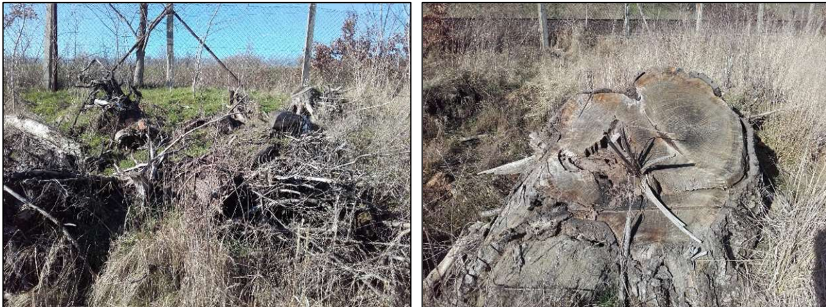
Abbildung 5: An den Rand geschobene Baumstubben (links); ein noch fester Stumpf einer Stiel-Eiche (rechts)