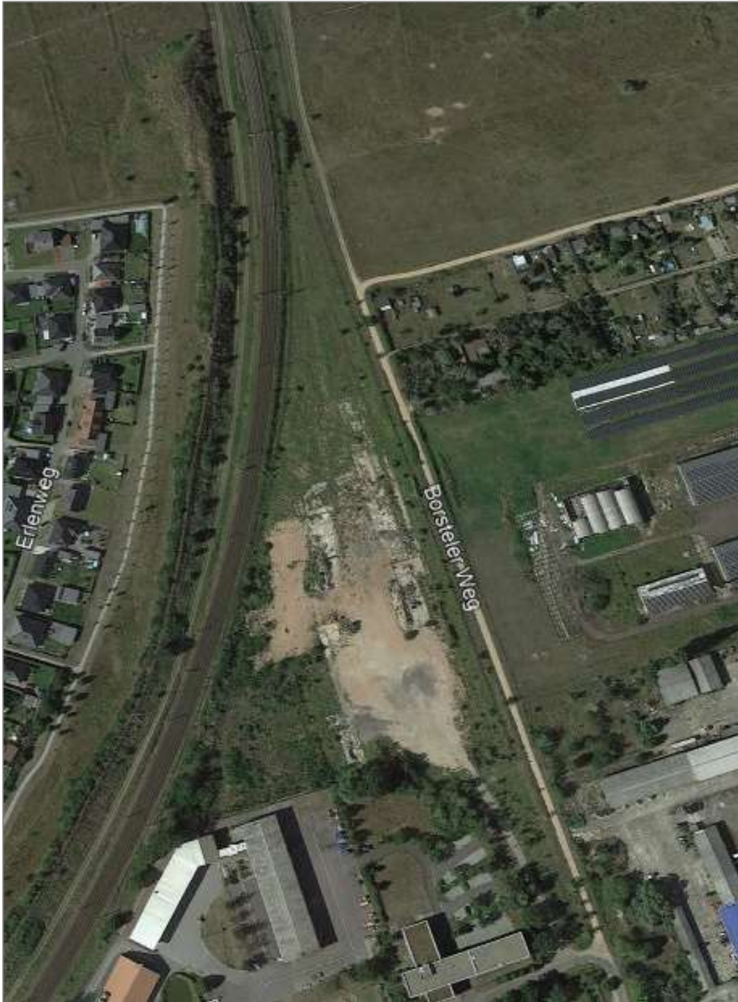
Abbildung 2: Das RAW-Ost in Stendal im Mai 2018