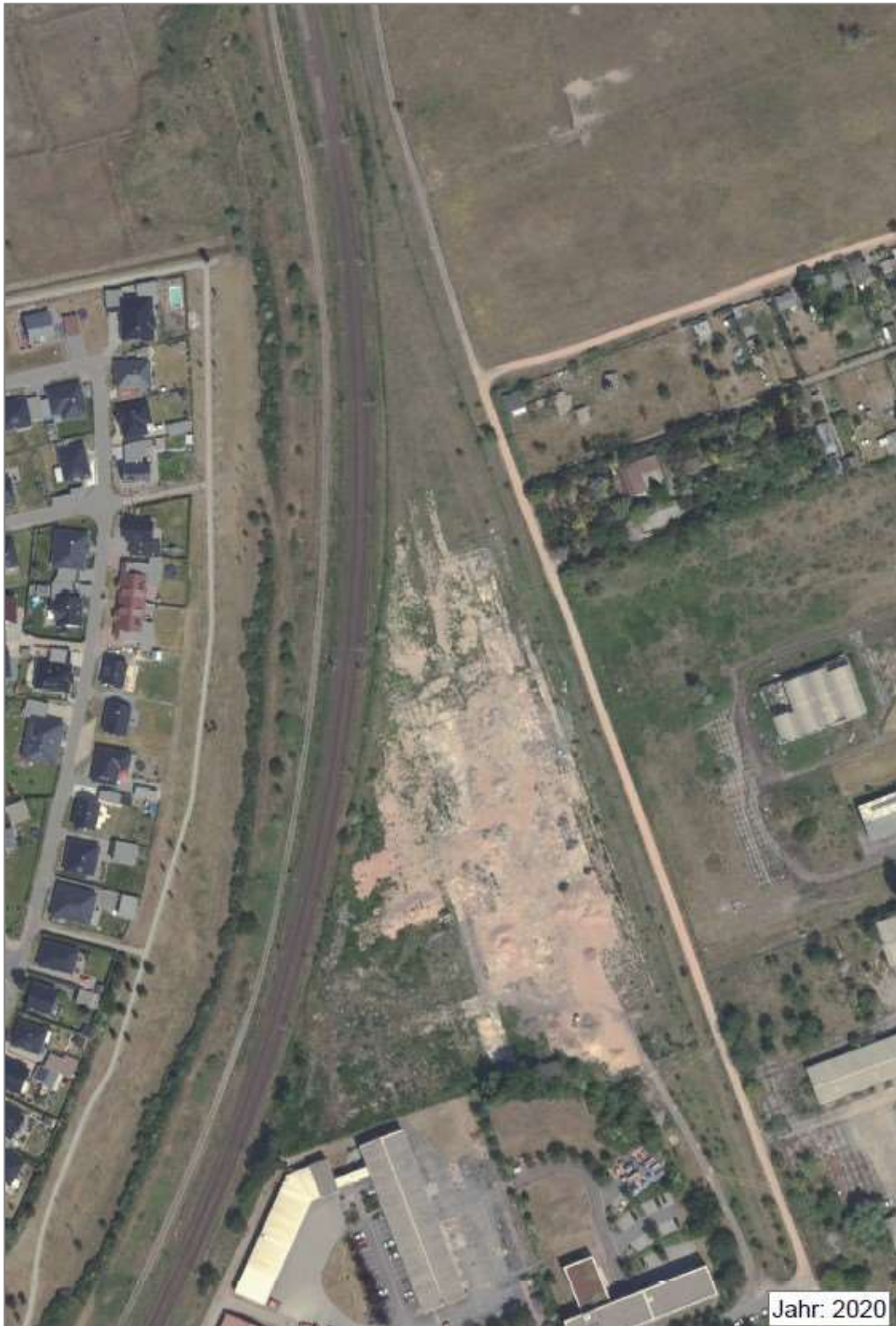
Abbildung 3: Das RAW-Ost in Stendal im Jahr 2020 (Digitale Orthofotos © GeoBasis-DE / LVermGeo LSA, dl-de/by-2-0).

Ein wichtiges Ziel der vorliegenden Unterlage ist es, den ursprünglichen Gehölzbestand, den Gebäudebestand vor Abriss sowie die aktuellen Biotoptypen des Plangebiets zu ermitteln.