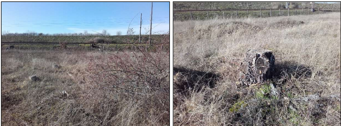
Abbildung 6: Ruderalflur im Bereich der zurückgebauten Gleisanlage mit Rose (links); Ruderalflur mit Sand-Birke als Einzelbaum und im Hintergrund Ablagerungen (rechts).