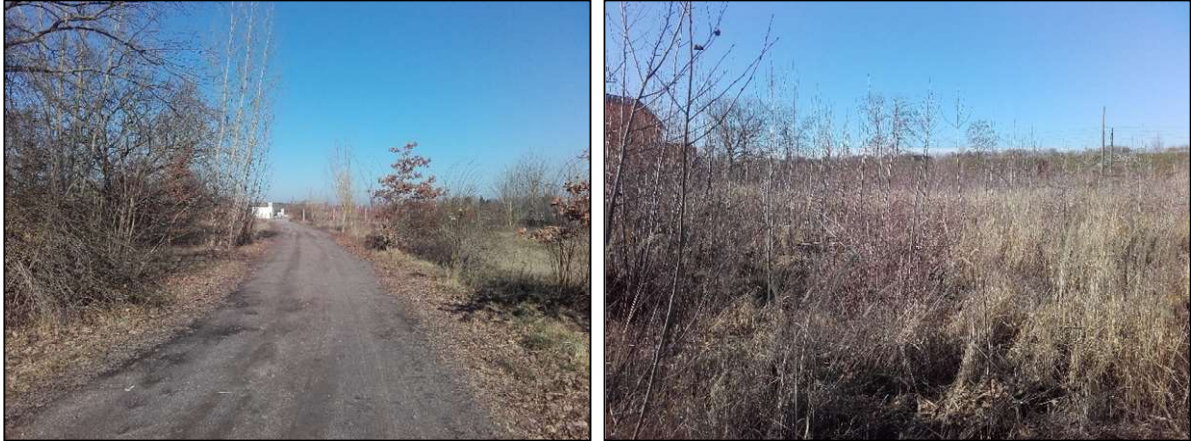
Abbildung 4: Zufahrtsstraße mit Ruderalflur und Gebüschsaum (links); ehemalige Fläche mit Baumbestand, heute Jungaufwuchs mit vorw. Hybrid-Pappel (rechts)