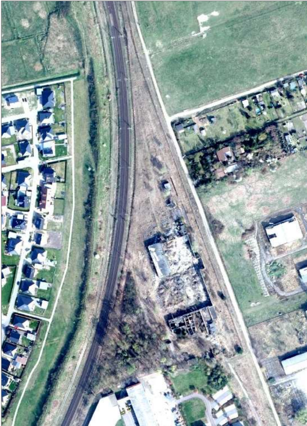
Abbildung 1: Das RAW-Ost in Stendal im Jahr 2017 (Digitale Orthofotos © GeoBasis-DE / LVermGeo LSA, dl-de/by-2-0).

Die Bauwerke auf dem Gelände des RAW-Ost wurden bis zum Mai 2018 vollständig abgerissen. Die Rodung des in Teilbereichen vorhandenen Gehölzbestands erfolgte ebenfalls vor diesem Zeitpunkt. Daher muss der Ausgangszustand anhand von Luftbildern (DOP) abgeschätzt werden (Abbildung 3 bis 3). Die Gehölzrodung muss zwischen 2017 und Mai 2018 stattgefunden haben. Der genaue Zeitpunkt lässt sich nicht mehr bestimmen. Zum Zeitpunkt des Grundstückskaufs durch den Inverstor des Solarparks waren keine Bäume mehr vorhanden. Die Fällung wurde nicht durch den Investor veranlasst. Die jetzige Betreibergesellschaft kann dies auch in einer eidesstattlichen Versicherung schriftlich abgeben.