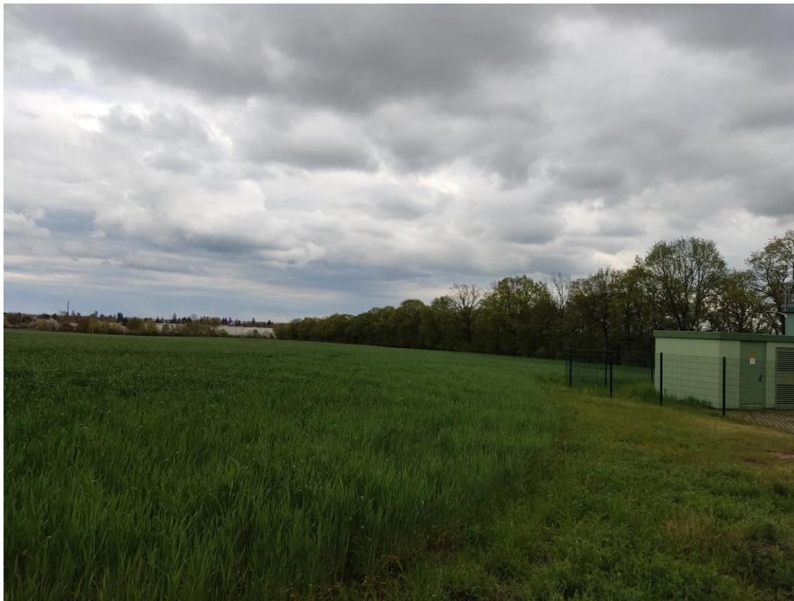
Abbildung 3: Blick von Planteil 1 auf die Allee und das Industriegebiet