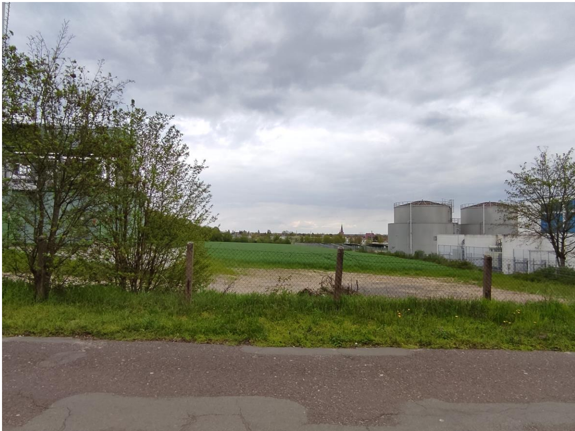
Abbildung 4: Sichtbeziehung von Planteil 2 (Westrand) zur Altstadt Stendal